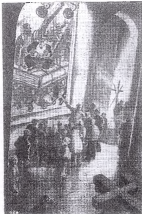
De Izak-Kathedraal in Leningrad werd veranderd in een anti-godsdiens-museum. Deze foto toont de uitlegging van een schilderij, voorstellende een groote Bijbel, waarop gezeten een kapitalist met twee geldbuidels. Hierdoor wordt het kapitalisme voorgesteld, dat beschermd wordt door het militarisme en geheiligd wordt door een priester van den staats-godsdiens

Een aanvullingsmotie, welke voorziet in de instelling van een gerechtshof voor grondwetkwesties, werd door de Cortes met de wet op de religieuze orden in Spanje met 118 tegen 51 stemmen aangenomen. Deze motie bepaalt, dat het in te stellen gerechtshof geen oordeel vellen mag over wetten die door de Cortes voor de instelling van het gerechtshof aangenomen zijn. Op deze wijze wordt verhinderd, dat de Katholieken zich tot het gerechtshof wenden, om een wijziging van de wet betreffende de religieuze orden en vereenigingen in te voeren.