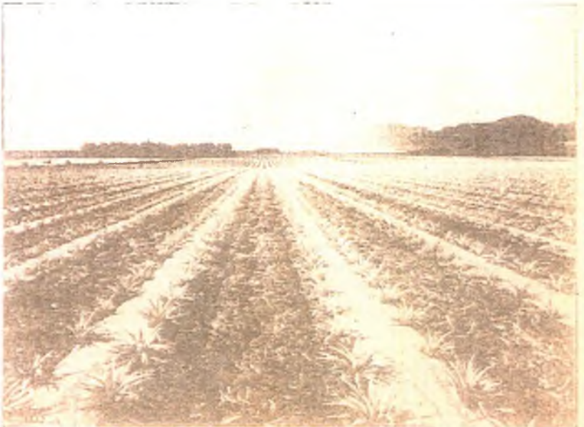
Ananasplantage bij Honolulu

De eilanden danken hun welvaart aan de suikercultuur. Maar de groote landelijke schoonheid van Hawai lokt ook jaarlijks duizende plezierreizigers uit de Vereenigde Staten en Mexico naar dit door de zee omspoelde paradijs.