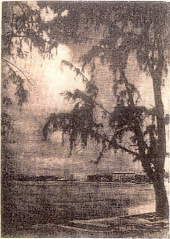
Gezicht op de hotels in Waikiki Beach, Honoloeloe