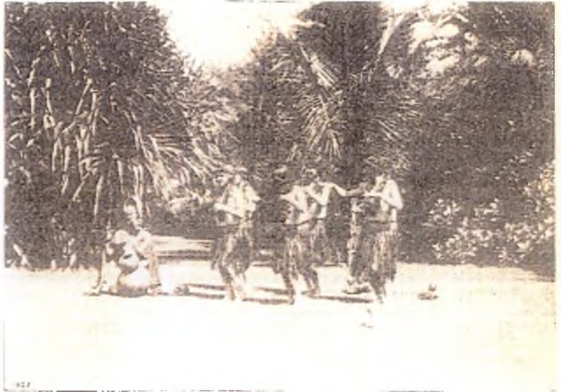
Hulcdanseressen met inlandschen „drummer“ op Hawai

Twintig vliegmachines met arsenicum giftgas geladen, zouden geheel Londen kunnen verdelgen, indien zij de stad tot op een hoogte van 12 tot 13 Meter met een doodelijk mengsel vulden. De eerste