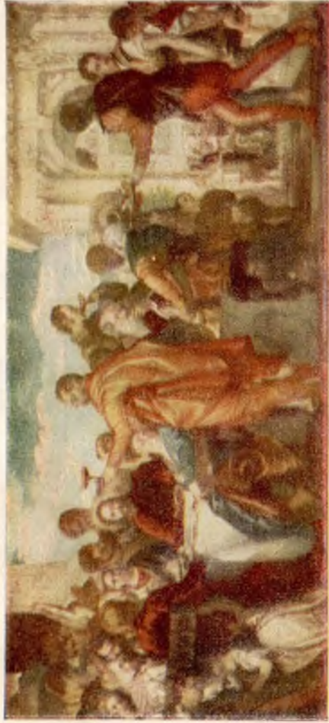
„Bruiloft te Cana“