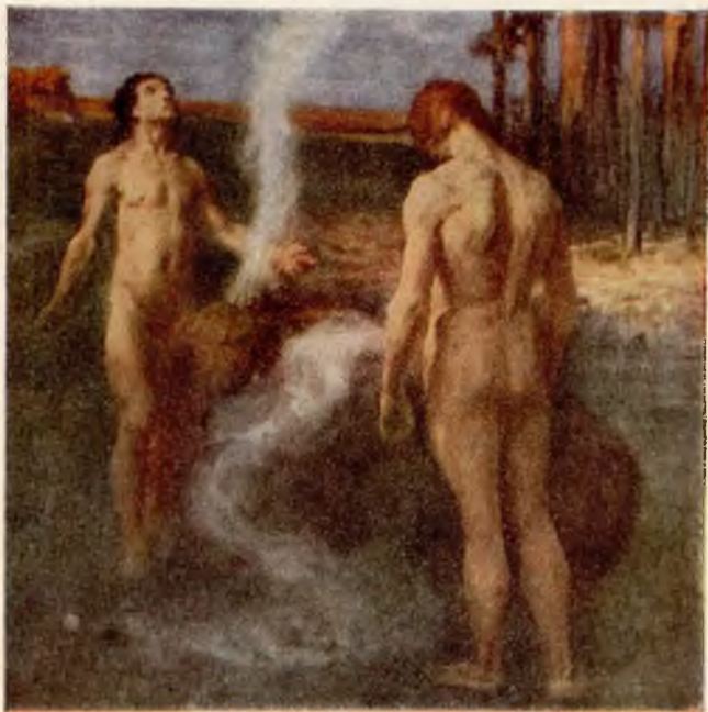
„Kain en Abel“