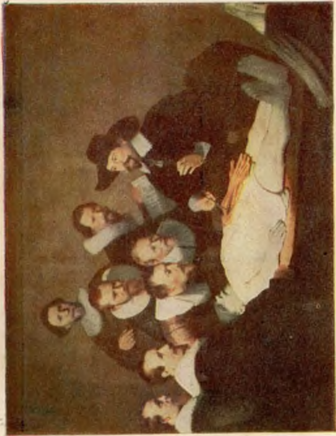
„De anatomische Les“

God schiep den mensch... Bewon- derenswaardige wijsheid wordt aan den dag gelegd... Zorgvuldig werd het juiste aantal beenderen bepaald, namelijk 206, om het menscheijkske- let samen te stellen. Een volm a a k t bloedsomloop-stel- sel werd gevormd. Voorts de longen, die het bloed rein en de circulatie in stand houden, als- mede het prachtig- ste elektrische sy- steem, dat wij ze- nuwen noemen... Alles tot in de kleinste bijzonder- heden werd zorg- vuldig uitgewerkt. — Bidz. 55.