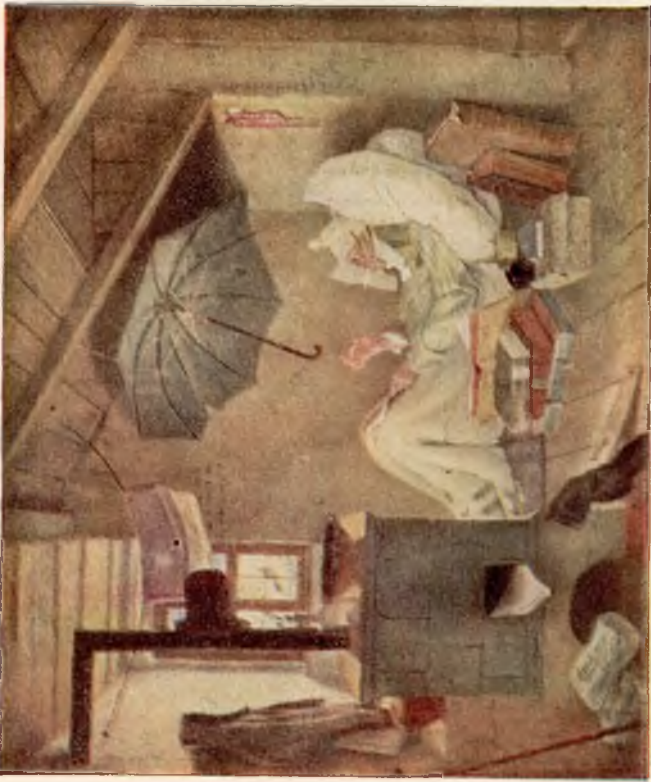
Wisheid dezer Wereld.