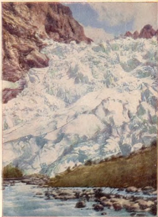
„Boven-Grindelwald-Gletscher in Zwitserland“

Toen het hemelgewelf verbroken werd, vielen de dampen en wateren neer op den dampkring der aarde. . . . De groote watermassa's, vermengt met ijs en sneeuw, die zich met donderend geraas tegen den evenaar stortten, moeten de heuvelen en bergen vermalen en een groote verandering in den vorm van de oppervlakte der aarde teweeggebracht hebben.