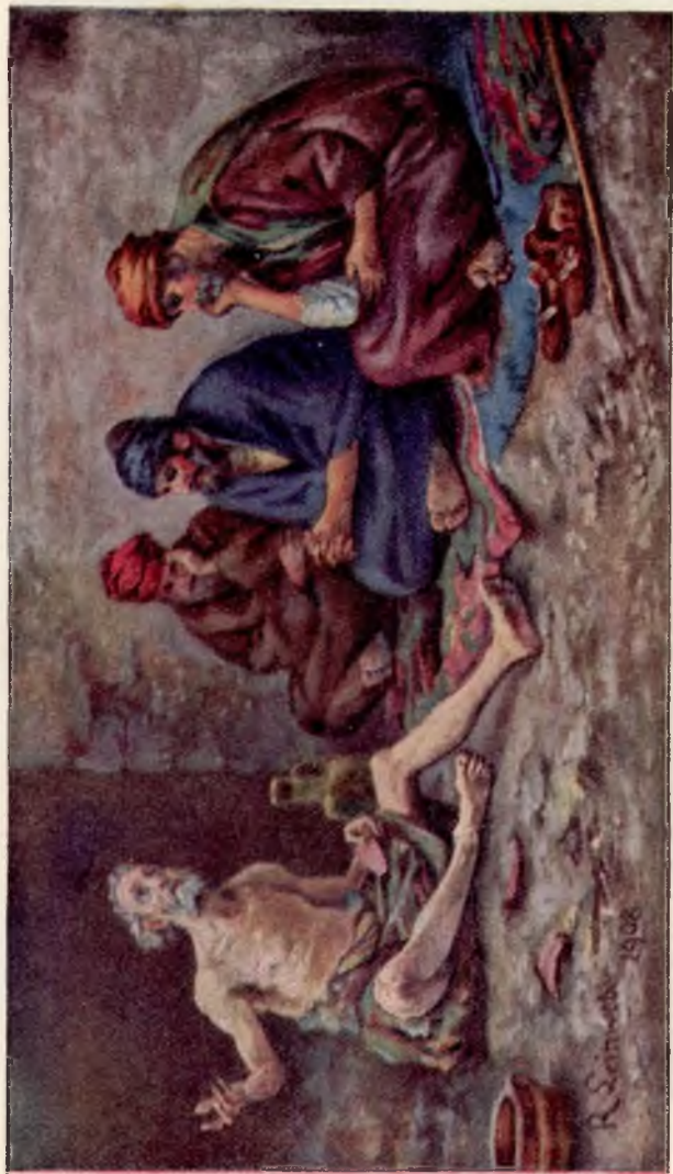
• Job en Satan's Vertegenwoordigers

Een beeld van de bezochte menschheid en haar bedriegelijke godsdienstige vertroosters