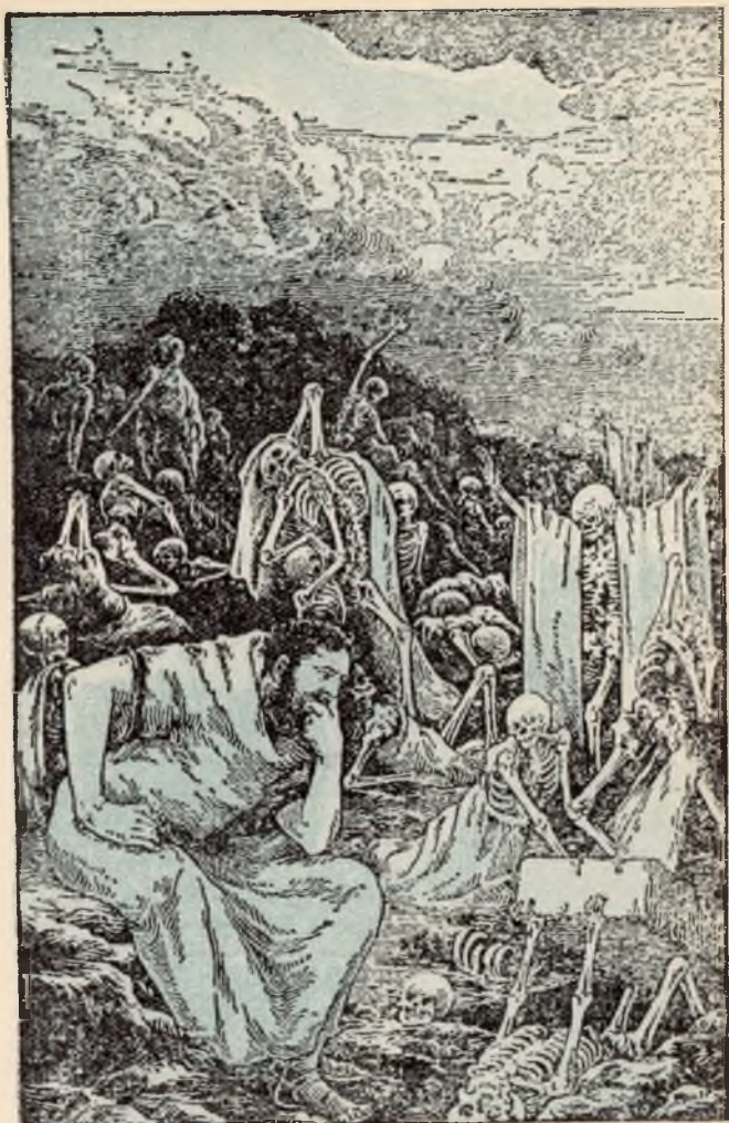
Het Dal van de dorre Beenderen