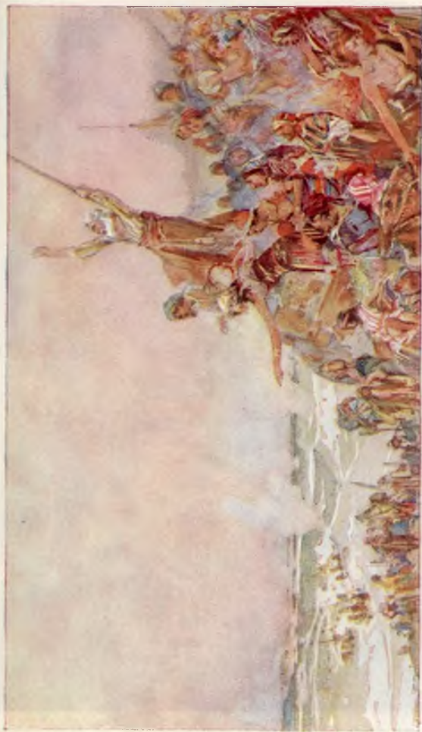
Israël's Bevrijding aan de Roode Zee kondiëde den aanstaanden al van 's menschen onderdrukkers aan