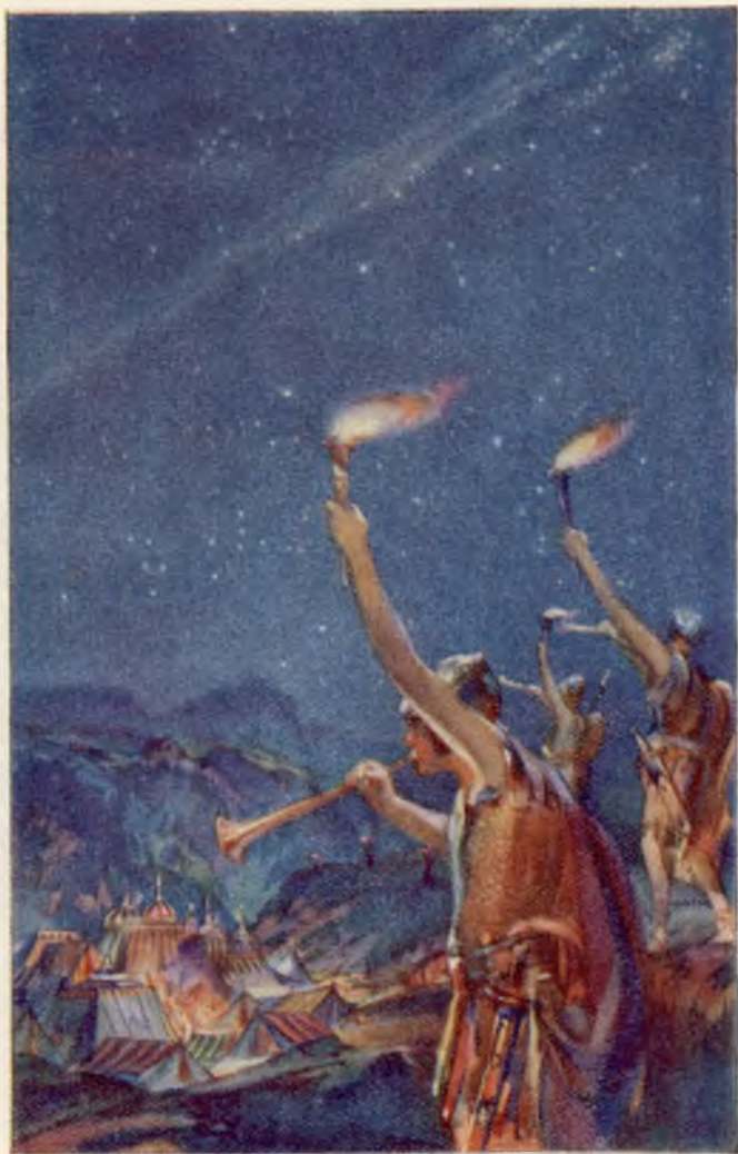
Jehova geeft Gideon de overwinning over de Midianieten „Het zwaard van Jehova en van Gideon.“