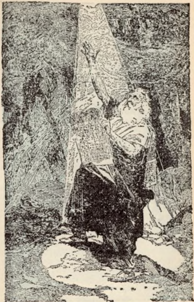
Mozes ontvangt de Wet op den Sinai