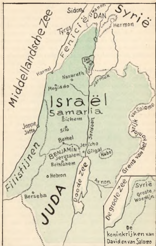
Palestina, het beloofde Land