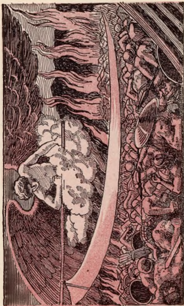
Jehova bevrijdt Jeruzalem van het Assyrische leger