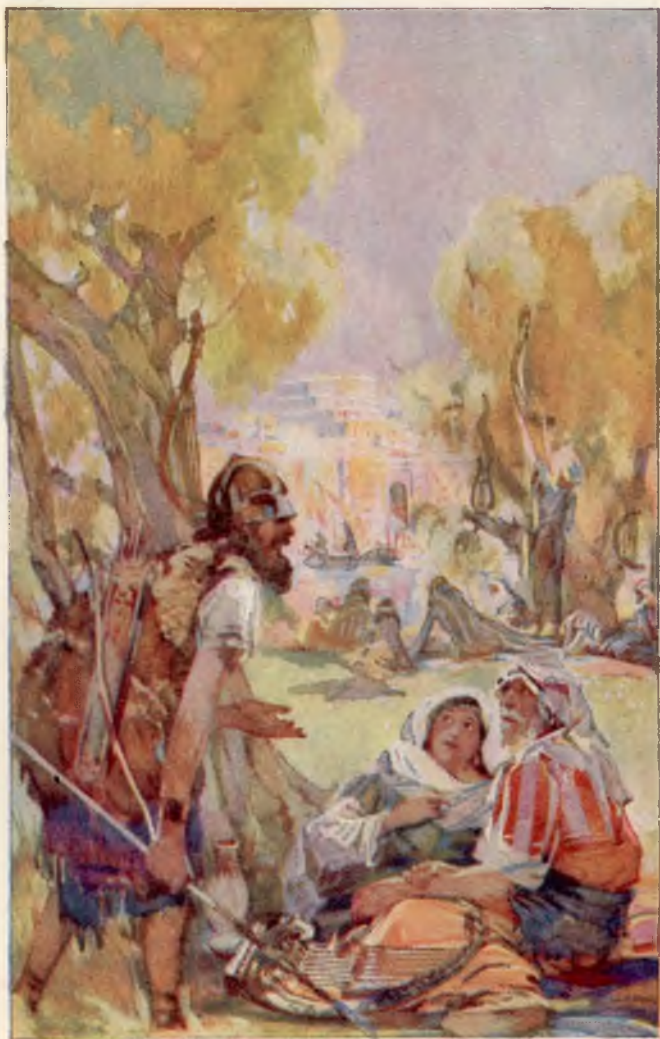
Joodsche ballingen treuren te Babylon