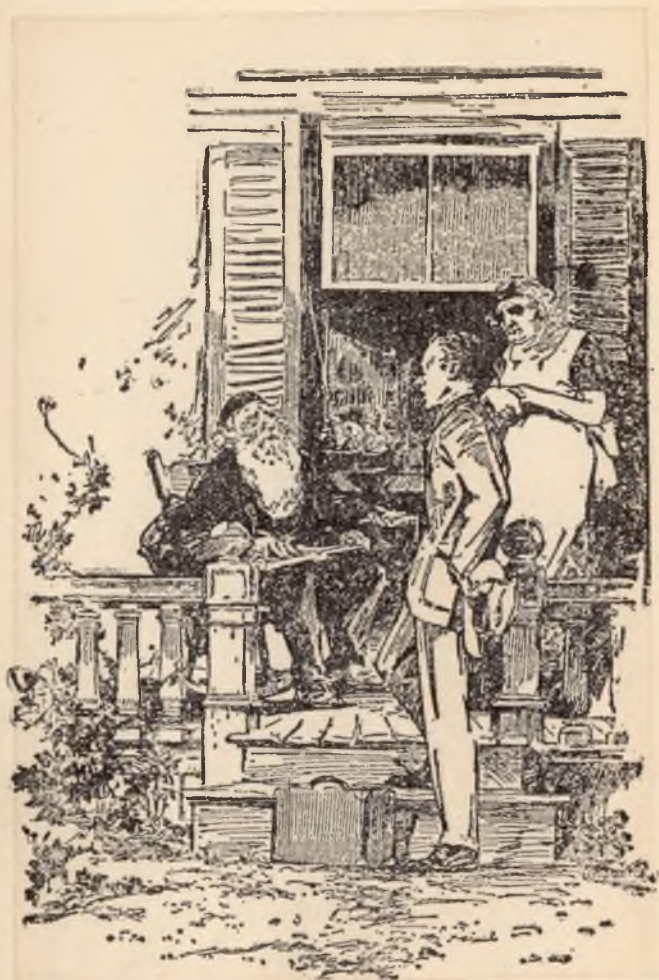
Troost mijn volk