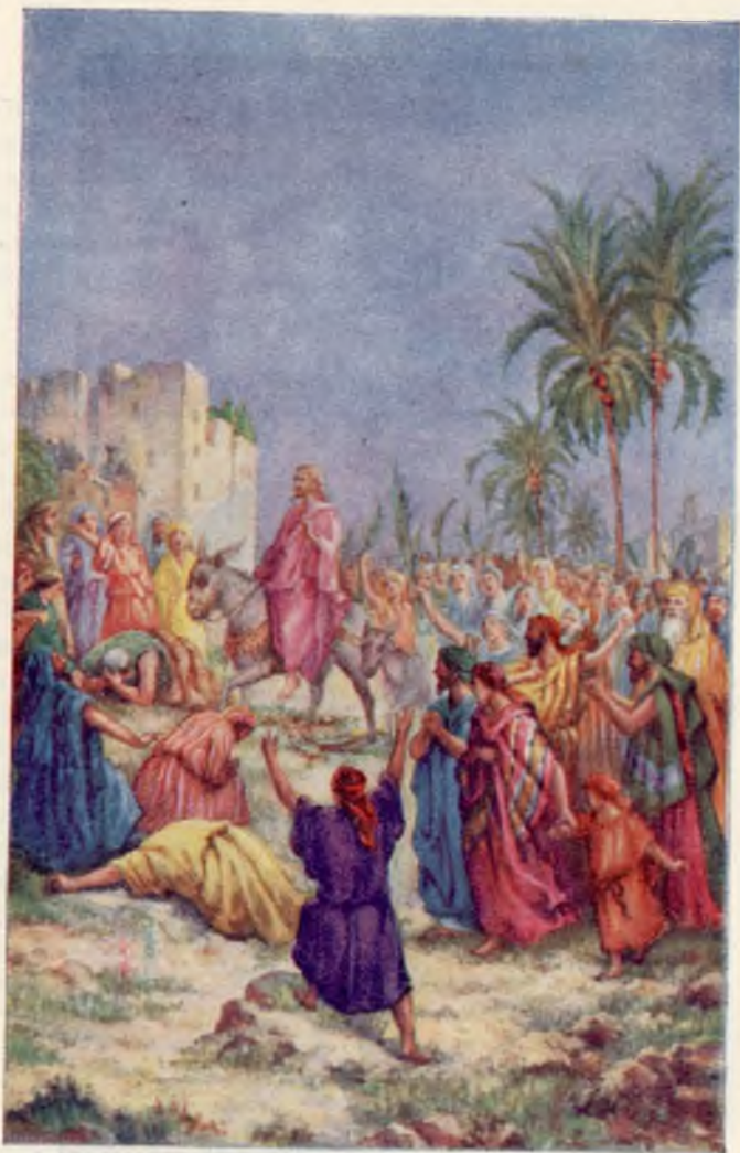
Toejuicing van den rechtmatigen Heerscher der Aarde