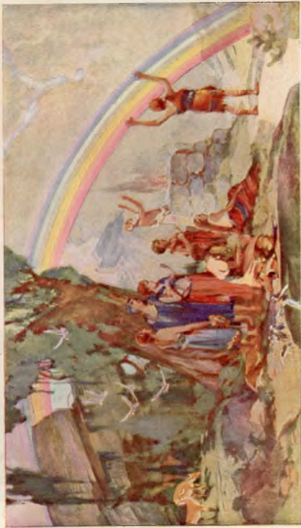
De eerste Regenboog