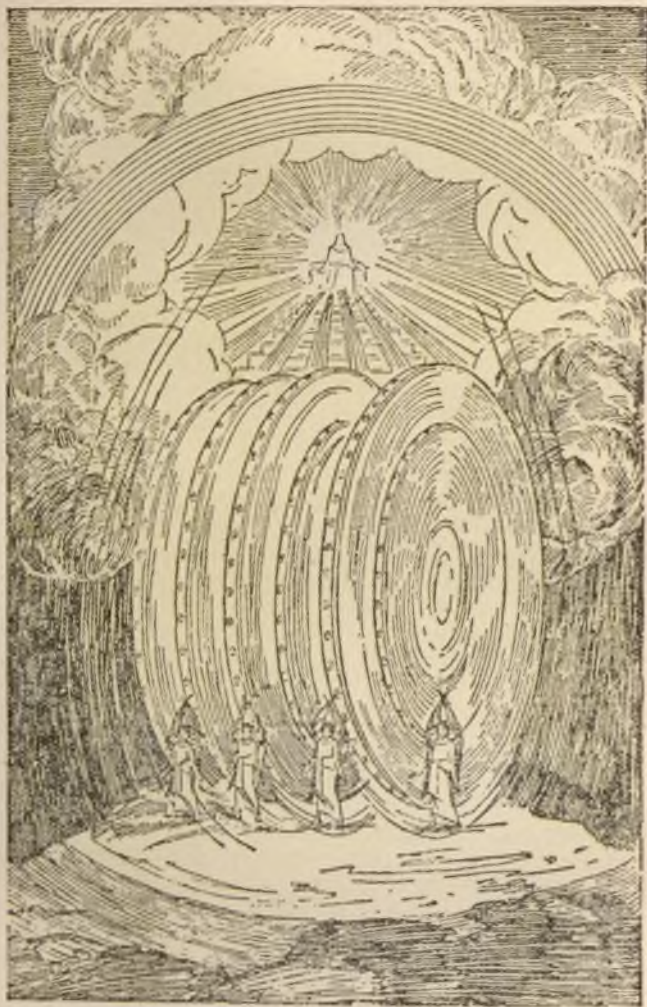
Ezechiël's gezicht, symbool van God's organisatie