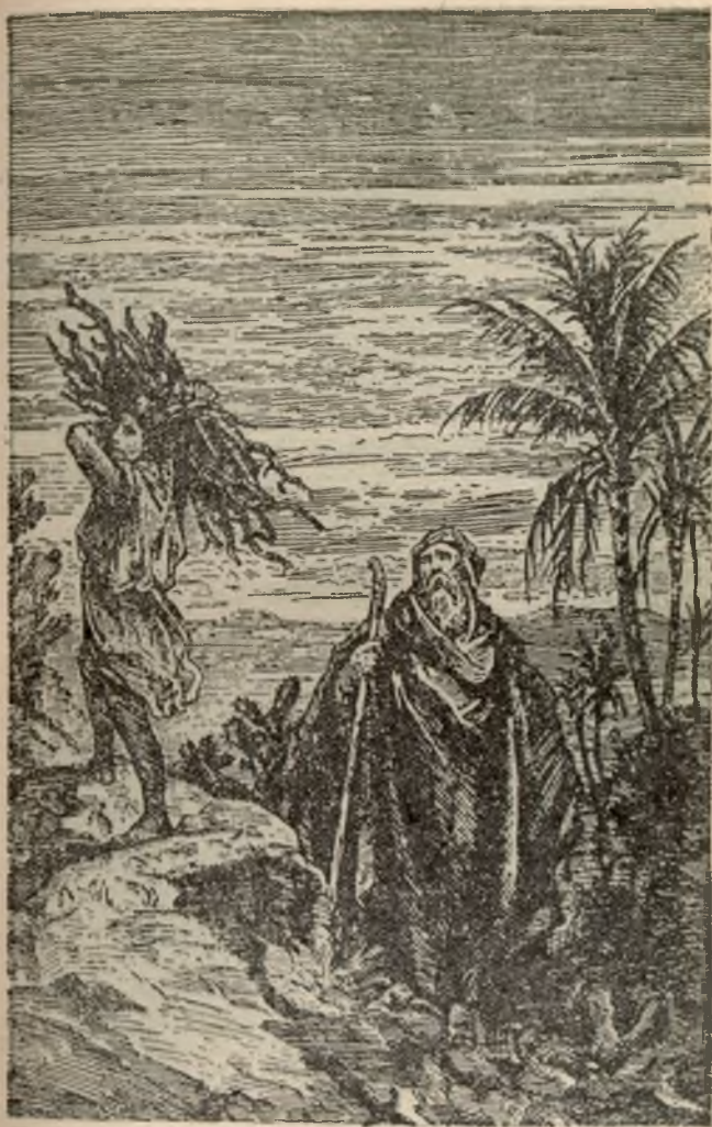
Door het geloof offert Abraham zijn zoon. Bldz. 40