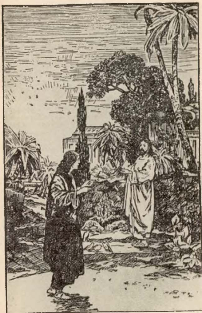
Christus verschijnt na Zijn Opstanding Bldz. 336