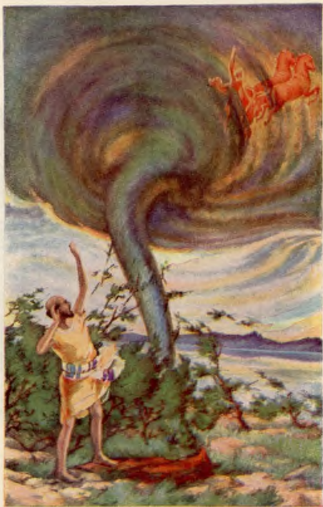
Scheiding tusschen Elia en Elisa