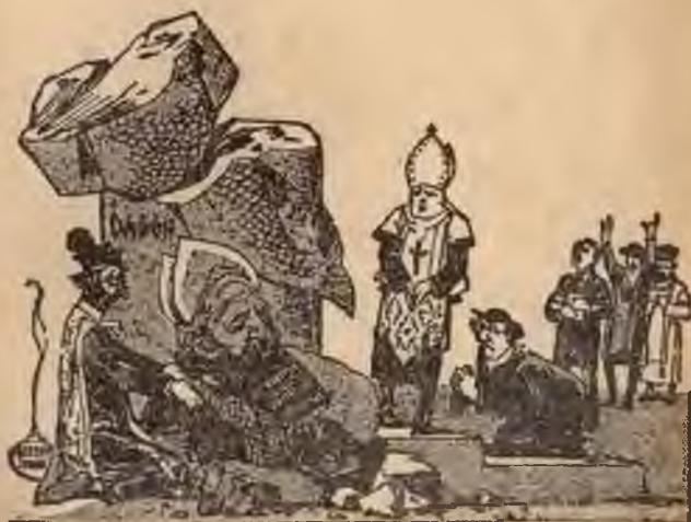
Jehova vernietigt Dagon, de vischgod der Filistijnen. (Voorstellende de vernietiging van de afgoden der „Christenheid”)