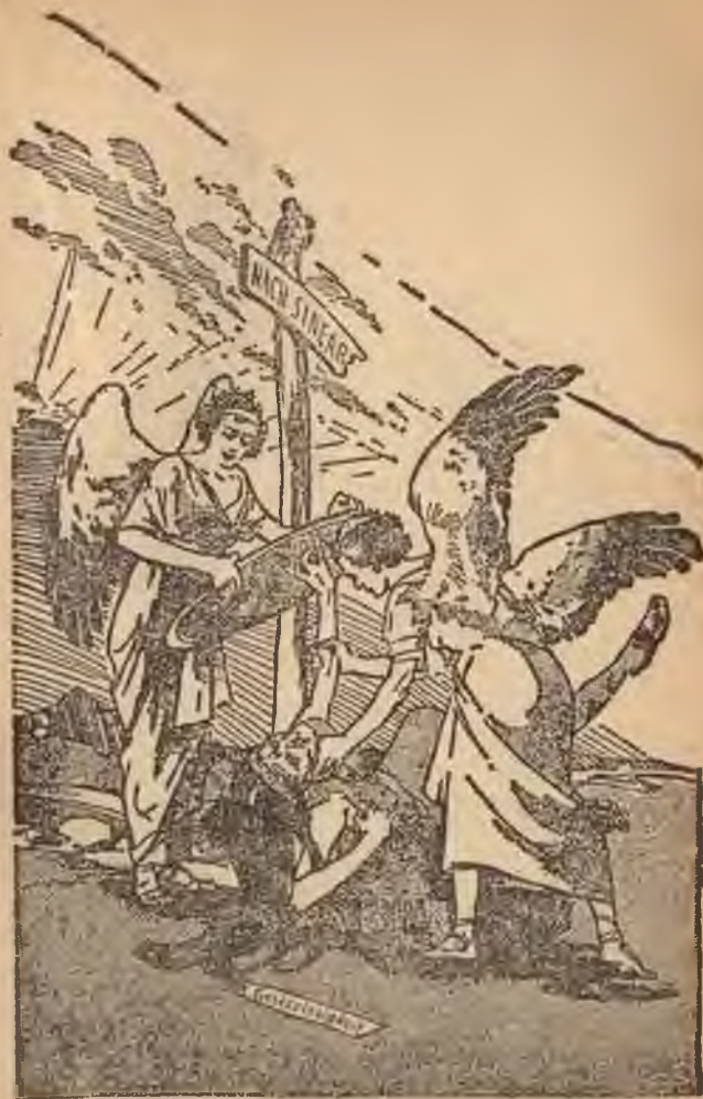
BEZIG „DE OUDE VROUW" TE VERWILDEREN (Zacht. 5: 5-11)