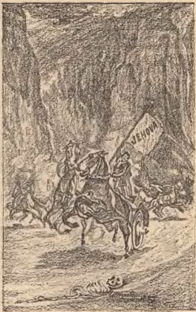
DE STRIJD BEGINT