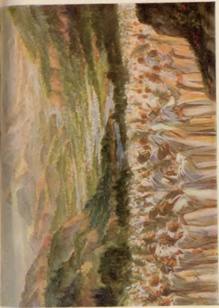
De groote Schare (Openbaring 7: 9-17)