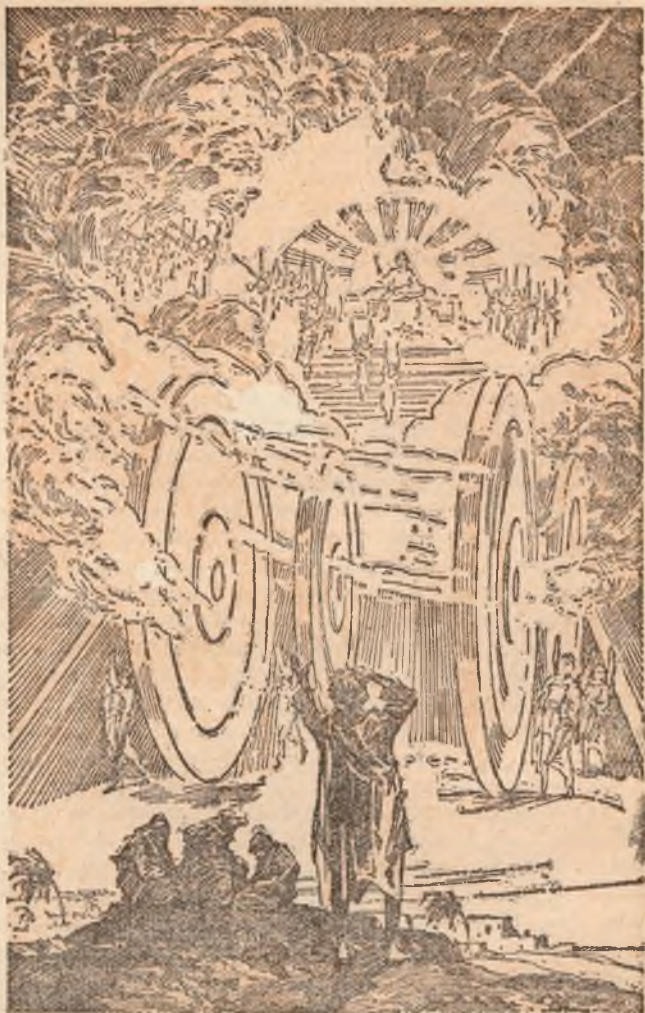
Jehova's Organisatie symbolisch voorgesteld Bldz. 66 en 299