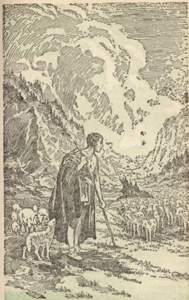
De „kleine Kudde” en de „andere Schapen”