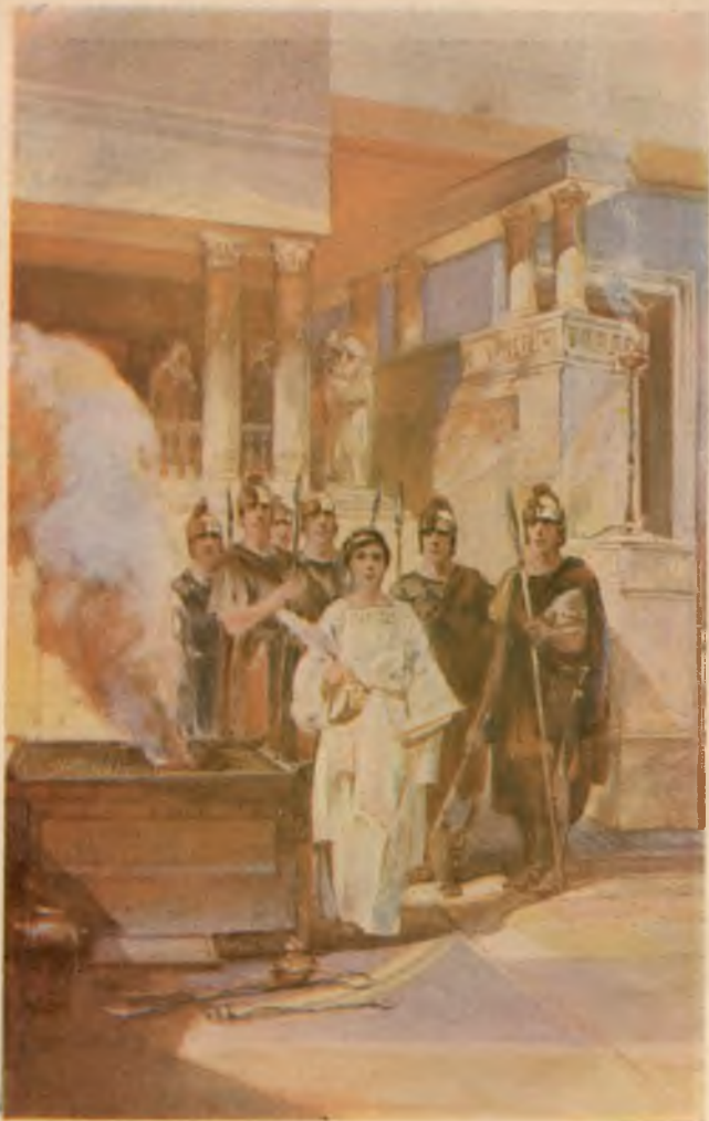
Jehova's opvoedende en vernietigende Krachten