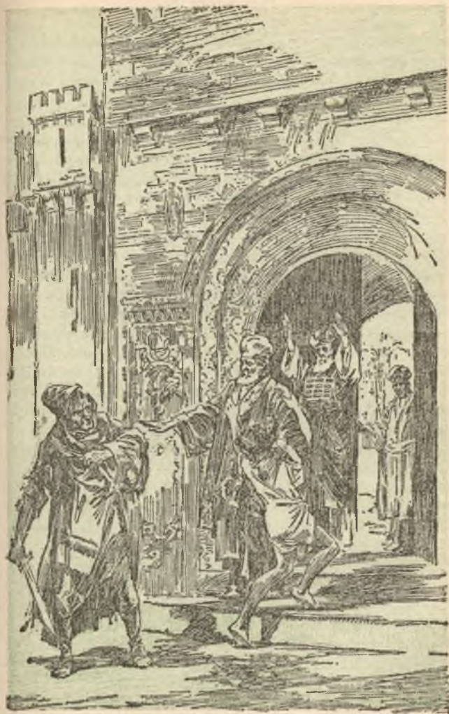
Vlucht naar Jehova's Organisatie