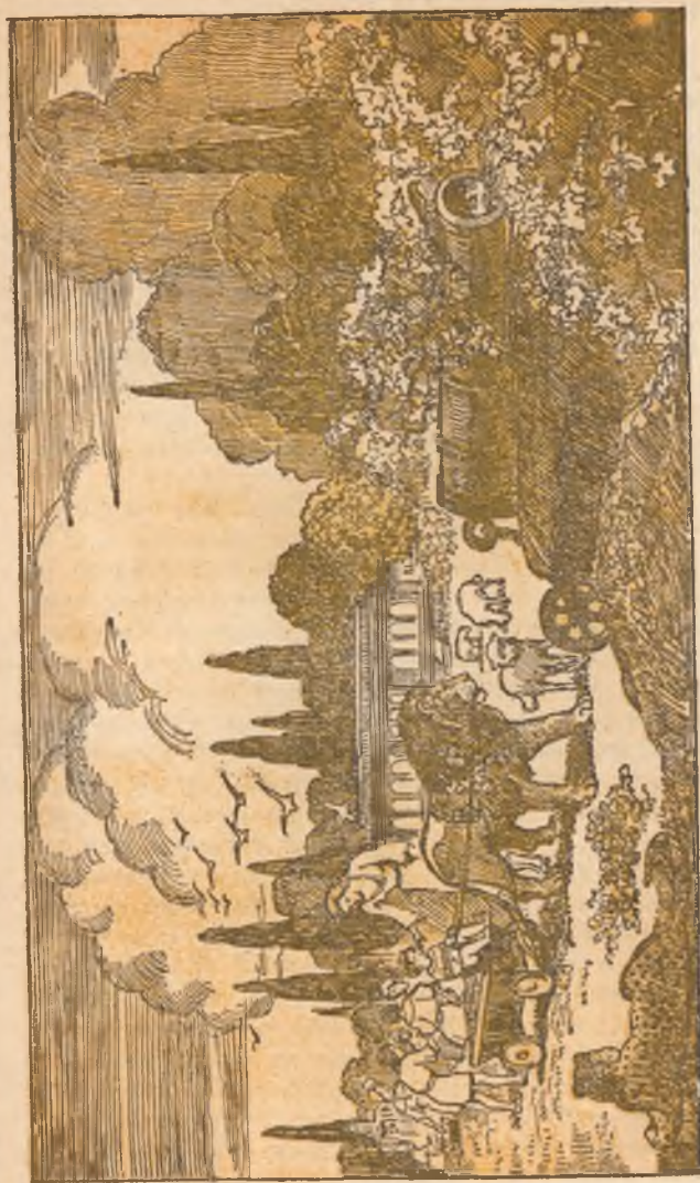
De Beërving van de Rijkdommen van het Koninkrijk Bldz. 335