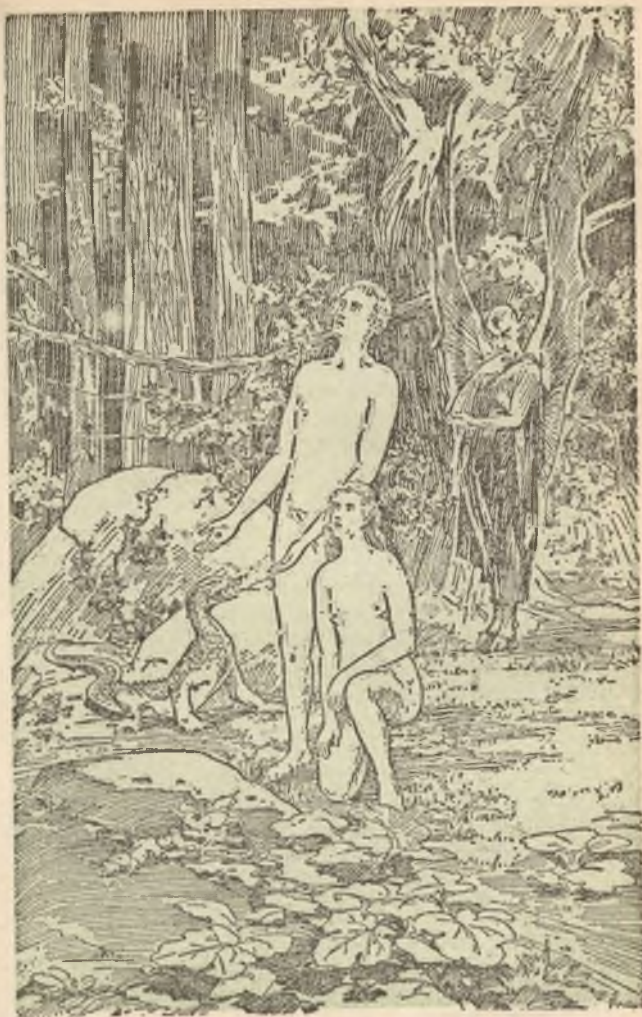
Lucifer werpt de Strijdvraag betreffende den Mensch op Bldz.153