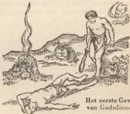
Het eerste Gevolg van Godsdienst

(Ezechiël 28: 14) Gezalfd zijn beteekent, dat hij door den Almachtigen God benoemd werd en de opdracht van Hem ontvingen had, om die zeer belangrijke positie in God's organisatie te bekleeden. Cherub beteekent iemand, wien