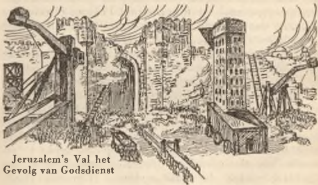
Jeruzalem's Val het Gevolg van Godsdienst

De profet van Jehova zegt: „Het zal geschieden te dien dage, dat Tyrus [het moderne Tyrus, de Roomsch-Katholieke Hiërarchistische organisatie] zal vergeten worden." Vergeten door wien? Door haar vroegere ongeoorloofde minnaars, die overspel met haar bedreven hebben. Zij wordt als tijdelijke macht vergeten. De politieke regeerende macht hield geen rekening meer met haar als tijdelijke macht, beschouwde den paus slechts als een geestelijken raadgever, zonder veel invloed, die men niet te vreezen had. Hieruit behoeft nog niet de gevolgtrekking gemaakt te worden, dat de Hiërarchie gedurende volle zeventig letterlijke jaren vergeten wordt. De profetie stelt duidelijk den tijd vast, waarin zij vergeten zal zijn, waar