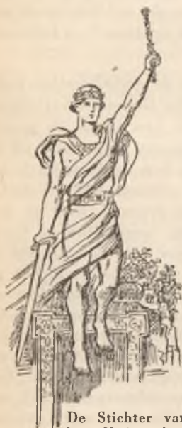
De Stichter van het Christendom

Wat wordt dan vereischt van iemand, die in aanmerking wenscht te komen voor de zegeningen, die God voor de gehoorzamen bereid heeft? De mensch moet eerst gelooven, dat God bestaat en dat Hij een