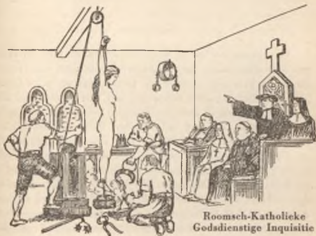
Roomsche-Katholieke Godsdienstige Inquisitie

prediken. In Duitschland, dat uiterlijk door den fanatieken Hitler geregeerd wordt, maar in het geheim beheerscht wordt door de Roomsche-Katholieke Hiërarchie en de Duivel, worden duizenden getrouwe en ware getuigen voor den Heer gevangen genomen, wreed geslagen en eenigen hunner zelfs op laaghartige wijze vermoord, omdat zij aangetroffen werden in het bezit van een Bijbel of boeken, die den Bijbel verklaren. In Italië, dat uiterlijk geregeerd wordt door Mussolini en in het geheim door het Vaticaan gedicteerd wordt, worden de getrouwe en ware navolgers van Christus Jezus wreed vervolgd. In Noord- en Zuid-Rhodesia, in West-Afrika, en vele eilanden der zee, en eigenlijk in alle landen der zoogenaamde „Christenheid” voeren de godsdienstaanhangers, en in het bijzonder de