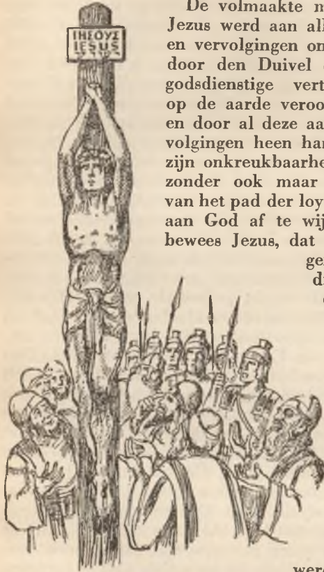
Godsdienstaanhangers vermoorden Jezus

zondigen mensch aanvaarden, en Hij deed dit ook. (Voor een nadere beschouwing van de verlossing des menschen zie men het boek Verzoening .)