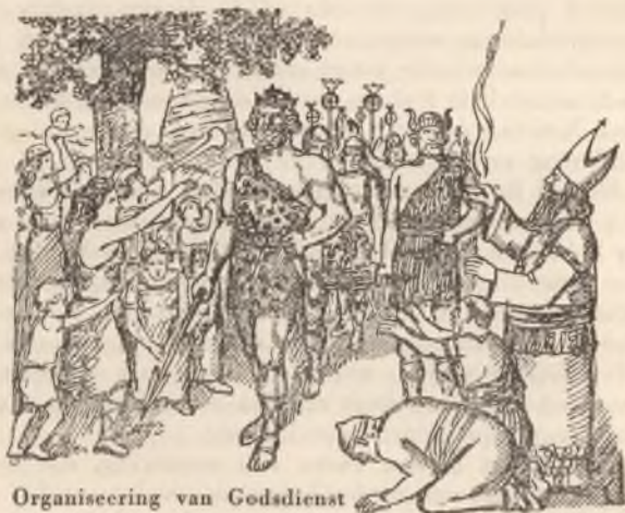
Organiseering van Godsdienst

gemaakt en Kusch gebruikt als een verkeerden leider, om de toenemende bevolking van Jehova God af te keeren. Zijn zoon Nimrod werd er met anderen op afgericht, God's eeuwig verbond te schenden en menschenvereering te stichten, en dit geschiedde met het doel, de zinnen van schepselen van den Almachtigen God af te keeren. Door middel hiervan tartte Satan den Almachtigen God en lasterde zijn naam, en voerde daardoor de beoefening van godsdienst op aarde in. Men dient van nu aan steeds te bedenken en in gedachte te houden: Godsdienst is steeds het voornaamste werktuig geweest, waarvan zich de Duivel bediend heeft, om den naam van den Almachtigen God