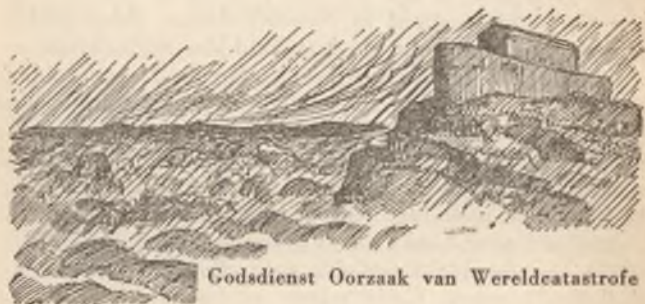
Godsdienst Oorzaak van Wereldecatastrofe

„mannen van naam” genoemd. Zij waren in macht andere menschelijke schepselen vooruit, maar niet den Almachtigen God. Voor Hem waren zij een gruwel. God's oordeel was tegen hen, en zij werden in den zondvloed vernietigd. Er was geen enkele reden aanwezig, hen in leven te houden, daar er geschreven staat: „De goddeloozen zullen vergaan.” (Psalm 37: 20) De machtige vloed der wateren kwam, en over de gevolgen er van staat geschreven: „En alle vleesch, dat zich op de aarde roerde, gaf den geest, van het gevogelte, en van het vee, en van het wild gedierte, en van al het kruipend gedierte, dat op de aarde kroop, en alle mensch. Alzoo werd verdelgd al wat bestond, dat op den aardbodem was, van den mensch aan tot het vee, tot het kruipend gedierte, tot het gevogelte des hemels, en zij werden verdelgd van de aarde: doch Noach alleen bleef over, en wat met hem in de ark was.” — Genesis 7: 21, 23.