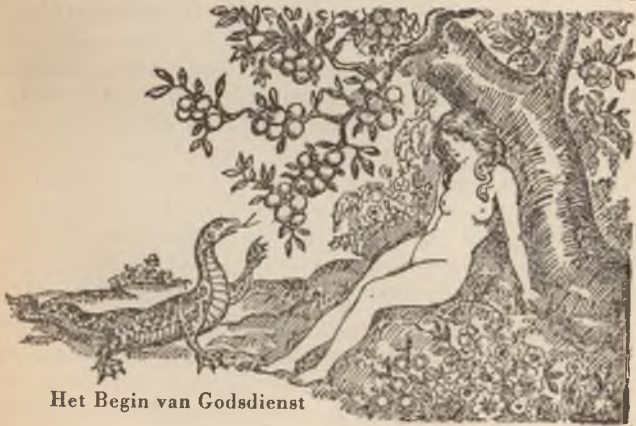
Het Begin van Godsdienst

laten overtreden, ging hij er toe over, aldus te handelen. Tot Eva zeide hij ongeveer het volgende: „Waarom eet gij niet van deze vrucht in het midden van den hof van Eden?” en Eva antwoordde, dat God toegestaan had, dat zij van alle vruchten der boomen uit den hof mochten eten, met uitzondering van de eene door hem genoemde vrucht, en dat God tot hen gezegd had: „Gij zult daarvan niet eten, noch die aanroeren, opdat gij niet sterft.” Eva zwichtte voor den verleidelijken invloed van den sluwen Duivel, at van die vrucht en gaf ze ook aan Adam, en ook hij at; op grond daarvan waren zij beiden wetsovertreders. (Genesis 3: 1-6) Het eten van de verboden vrucht moge aan eenigen een onbeduidende daad toeschijnen, te gering voor de doodstraf, maar men diene te bedenken, dat het vergrijp bestond in de overtreding van God's wet en omdat dit geschiedde na vooraf ingelicht geweest te zijn, was de straf op deze overtreding de