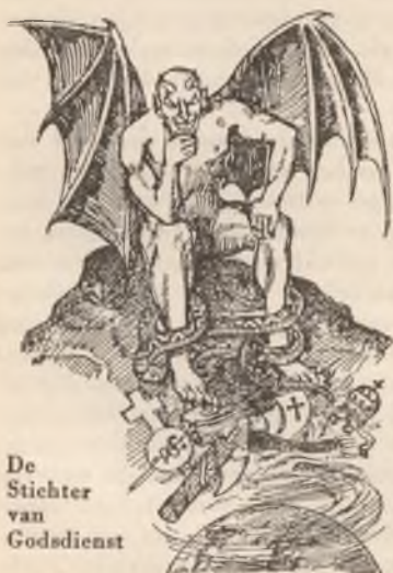
De Stichter van Godsdienst

Inplaats van er partij van te trekken zullen deze bedrogenen en bondgenooten der Roomsche Katholieke Hiërarchie verbleeken en ziek worden, als zij zien, hoe de macht der Hiërarchie zwicht voor Jehova's