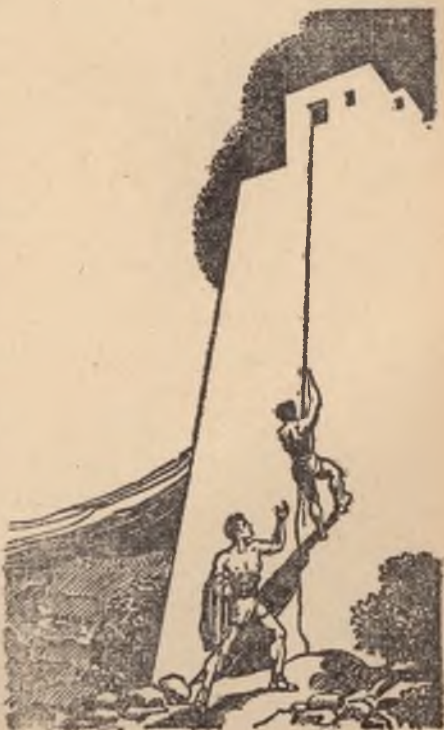
De vlucht der verspieters uit Jericho. Jozua 2 : 15.

183 De snoer van scharlaken draad, waarlangs de mannen ontkwamen en die later door Rachab als teeken uit haar venster gehangen werd, is een symbolische voorstelling van het vergoten bloed van Christus Jezus, waarin alle personen, die gered wenschen te worden, vertrouwen moeten stellen. Zij, die tot de hemelsche klasse behoorren, hebben zich te verlaten op het kostbare bloed van Christus Jezus als hun schild tot verkrijging van het leven. Evenzoo moeten de leden van de groote schare geloof en vertrouwen op het vergoten bloed van Christus Jezus hebben, waarin zij „hunne kleederen wasschen”, waar-