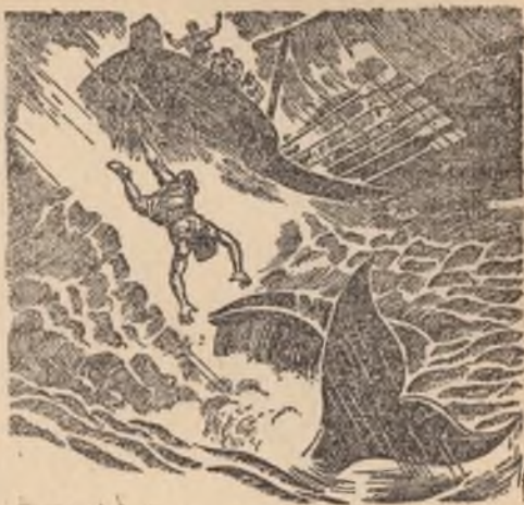
Een wonderlijke redding. Jona 1 : 17

het bijzonder na 1918. Sedert 1918 zijn Jehova's getuigen steeds voortgegaan „dit Evangelie des Koninkrijks” over de geheele „Christenheid” te prediken; vele menschen van goeden wil hebben er gehoor aan geschonken, terwijl het grootste deel de waarheid verworpen heeft.