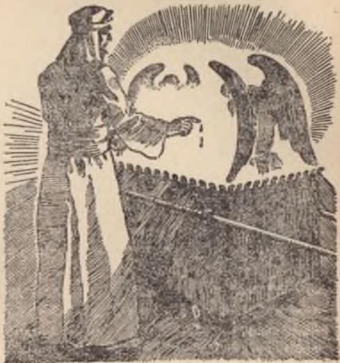
Het brengen van het offer in het voorbeeld. Lev. 16 : 15, 16.

389 Het zoen-offer is de aanbieding en uitbetaling van dit bezit, deze waarde of koopprijs aan Jehova God. Jezus stierf op aarde, Zijn bloed werd als loskoopprijs vergoten. God wekte Jezus als een geest uit den dood op en verhief Hem in den hemel, volledig bekleed met alle macht en gezag, om God's voornemen ten uitvoer te brengen.