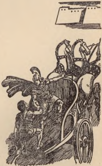
Jonadab bestijgt Jehu's wagen.

h e t g e e n daarbij plaatsvond, vormt een beeld of profetisch drama, een model of een afbeelding van de verhouding, die er thans tusschen de menschen van goeden wil op aarde met Christus Jezus en de leden van van Zijn lichaam bestaat, zoodat dus dit profetisch beeld samengesteld en opgeteekend werd in het speciale belang van de menschen, die heden op de aarde leven. (Zie De Wachttoeren van September en October 1932, onder den titel „Jehova's Scherpreeker”.)