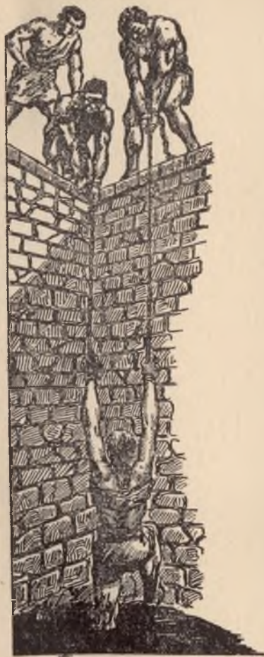
Ebed-Melech bevrijdt Jeremia.