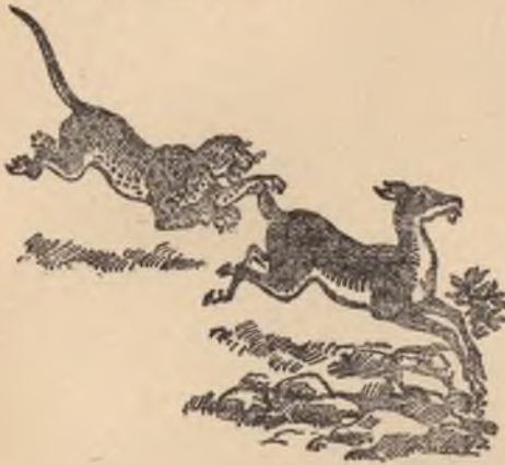
Dictator Nimrod op jacht.

en m a c h t i g e was, zooals ge- schreven staat: „Kusch nu ge- won Nimrod; die begon gewel- dig te zijn op aarde”. - 1 Kro- nieken 1 : 10. „Hij was een geweldig jager [doodslager] in strijd met Jeho- va”. - Genesis 10 : 8, 9; Septu- aginta. Toen hij zich zelf een naam gemaakt had, stichtte hij een koninkrijk; „en het begin zijns rijks was Babel”, dat is B a b y l o n, dit geschiedde in strijd met Jeho- va. - Vers 10.