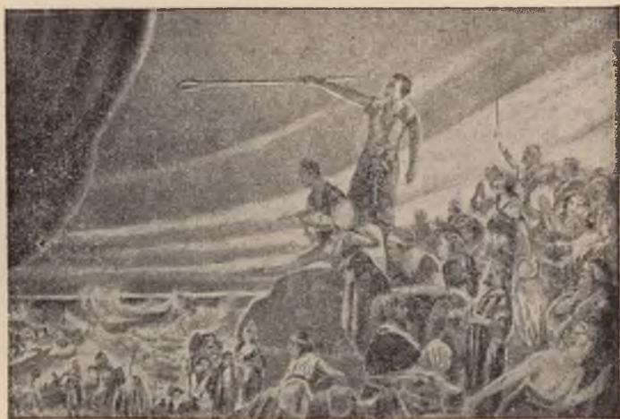
De doortocht door de Roode Zee. Een treffend Beeld van Jehova's Almacht en Redding in Armageddon.

534 De vloed was geëindigd en op God's bevel gingen Noach en zijn familie uit de ark. Deze acht personen waren de eenige op de aarde overgebleven mensche-lijke schepselen. God maakte toen aan Noach Zijn