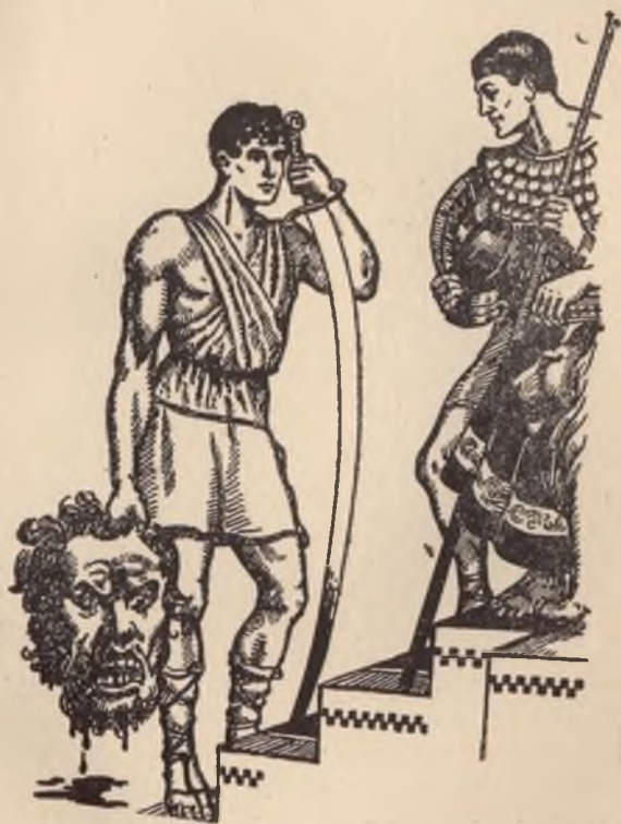
Jonathan ontmoet David.

David in zijn hart — Menge], en Jonathan beminde hem als zijne ziel. En Saul nam hem te dien dage, en liet hem niet wederkeeren tot zijns vaders huis. Jonathan nu en David maakten een verbond, dewijl hij hem liefhad als zijne ziel; en Jonathan deed zijne mantel af dien hij aanhad, en gaf hem David, ook zijne