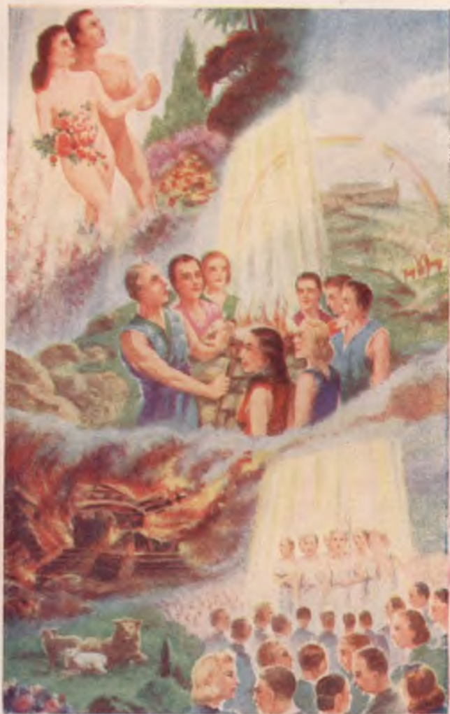
Jehova's voorziening: Het Paradijs voor mensen van goeden wil. Jes. 60 : 21, 22.