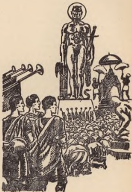
Weigerend den Duivel te aanbidden.

Met den meesten nadruk: Neen. Indien een staat een wet uitvaardigt, lijnrecht in strijd met God's wet, kan iemand, die een verbond gesloten heeft, om den wil Gods te doen, zulk een wet niet gehoorzamen. In geen geval kan hij rechtmatig gedwongen worden, God's wet