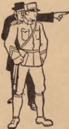
... en heden!

De priesters en dominees, over het algemeen „geestelijken” genoemd, die zoowel de katholieke als ook de protestantsche kerkelijke organisaties leiden, bestrijden op scherpe wijze de boodschap van den Bijbel, die Jehova's getuigen aan het volk overbrengen. Wanneer, zooals dit het geval is, de geestelijken voor-geven God en Christus te vertegenwoordigen en Jehova's getuigen hetzelfde beweren, waarom zou de geestelijkheid zich dan tegen de boodschap van deze getuigen verzetten? Het juiste antwoord op deze vraag geeft de Bijbel ons.