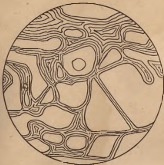
„Mars“ door de verrekijker gezien met zijn „kanalen“.

Zoals door waarnemingen en photo's werd vastgesteld, zijn de polen van Mars met sneeuw bedekt; in het Marsvoorjaar minder en 's winters meer. Hierdoor komt men tot de gevolgtrekking dat op Mars toch nog een zeer dunne atmosfeer aanwezig moet zijn, die dergelijke veranderingen in de natuur en het weer veroorzaakt.