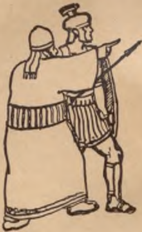
In de dagen van Jezus