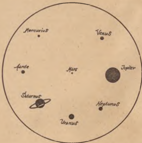
De planeten in verhouding tot de Zon. (voorgesteld door de groote kring)

vloeibaar kon zijn; zijn stabiliteit is alleen verzekerd, als hij uit talloze afzonderlijke deeltjes bestaat, die als wachters elk een eigen baan om de planeet beschrijven. In overeenstemming daarmee werd, zoowel in 1906 als in 1921 de ring flauw gezien, toen wij tegen de niet door de zon beschenen zijde aankeken: blijkbaar vond het licht gelegenheid, tusschen de afzonderlijke ringdeeltjes door, de andere zijde te bereiken. Dit ringstelsel bestaat uit vijf ringen, die gelijk kachelringen naast elkaar liggen.