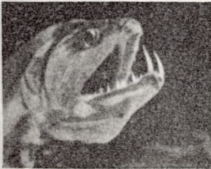
De Zuidamerikaansche soort Hondsvisschen behoort tot de griezelige bewoners der zee. Zij maken ook de riviermondingen der Braziliaansche rivieren onveilig.

„De menschelijke taal is te arm, om de heerlijkheid en pracht van de natuur te beschrijven, die ons de diepte tot dusver heeft verborgen. We gingen om 9 uur 's morgens in onze duikgondel, de 400 pond zware pantserdeur werd achter ons gesloten en wij werden langzaam door den kraan van het schip, dat ons begeleidde, te water gelaten. In het begin omringde ons nog het kristalheldere water, waar de zon nog door-