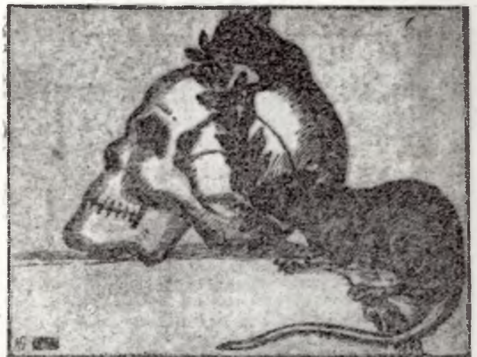
„ER WAS EENS EEN DICTATOR"